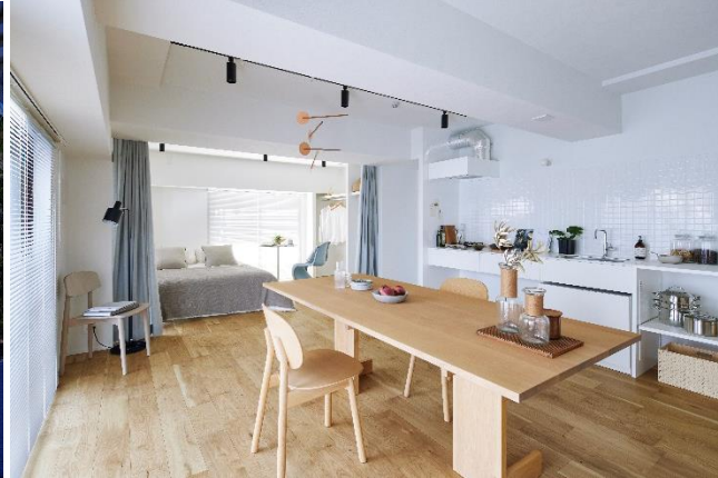
左上：共用エントランス | 右上：くると一周、広くて明るいワンルーム（PATH 駒込） 左下：共用エントランス | 右下：生活スタイル毎にレイアウトが自由な空間（PATH 浅草）