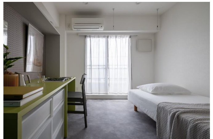
造作家具のデザインを担当した専有部

〈専有部の造作家具について〉外側のフレーム内に洋服掛・カウンター・有孔ボードが取り付けのみのシンプルな構成で、引き出しやフックなどを追加しながら住まう人それぞれの使い方ができるよう余白を残しています。また、インテリアの背景となるよう主張しすぎず、すっきりとした青・緑、グレーの色を組み合わせています。