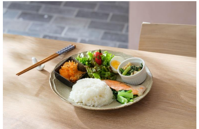
メニューイメージ