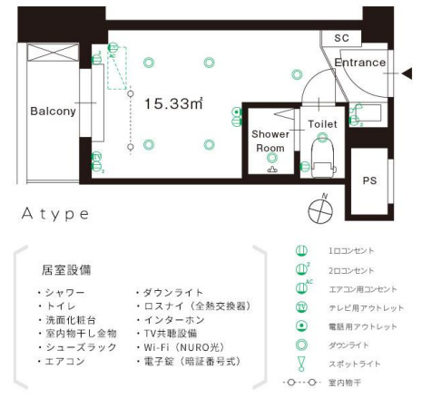
『Well-Blend 阿佐ヶ谷』の専有部代表プラン平面図