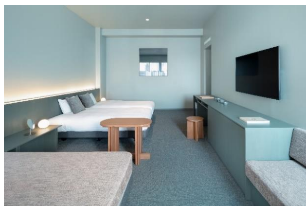
画像左 : B1Fのアートストレージ 画像右 : ゲストルームの一室 (SUPERIOR 4)