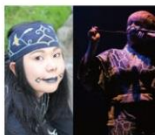
[artist] REIKO&MAYJUN From MAREWREW レクボ & マユン From マレウレウ

マレウレウとはアイヌ語で「蝶」のこと。 アイヌの伝統歌「ウボボ」の再生と伝承をテーマに活動する女性ヴォーカルグループ。そのマレウレウよりメンバー2名がライブに登場！！ さまざまなリズムパターンで構成される天然トランスな感覚が特徴の輪唱をドリング片手に楽しみたい。