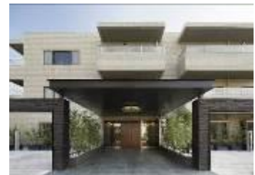
100平米超マンション「R100 TOKYO」 r100tokyo.com/