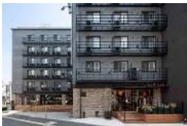
原宿神宮前「THE SHARE」 www.the-share.jp/

住所：東京都目黒区三田 1-12-23MT2ビル URL： www.rebita.co.jp