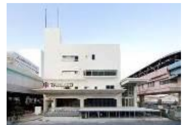
オフィス商業複合施設「TABLOID」 www.tabloid-tcd.com/