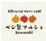
【野菜・果物販売】 ベジ旨マルシェ Kawasaki

シエスタキッチンからの出店！！ 新鮮で安心な「旨い」野菜の取り揃えは勿論のこと。 野菜のことなら何でもあれ、「旨い」食べ方から調理方法から親切丁寧に教えてくれます。