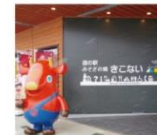
【協賛出店】 木古内町 道の駅 みそぎの郷きこない

木古内町とHakoBAがタイアップし道の駅「みそぎの郷きこない」の限定ショップが期間限定オープン。 おいしい木古内グルメや、銘酒「みそぎの舞」をはじめとする特産を販売いたします。限定ショップは1周年イベント日を含め、6/15～6/17の3日間営業いたします。ぜひお越しください。