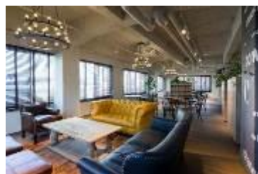
シェア型複合施設「the C」 the-c.tokyo/