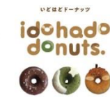
【ドーナツ販売】 いどほどドーナッツ

～移動して波動を送る～ をキーワードに、移動販売からスタートして、ドーナツ店がこの春弥生町にオープン！今回は、原点である移動スタイルでHakoBAに限定登場です。 素材にこだわった毎日食べたいおやつドーナッツを作っています。 ドーナツ、一つ一つに名前があり、意識を持った生き物のように波動をお届けします。