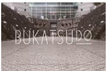
街のシェアスペース「BUKATSUDO」 bukatsu-do.jp/