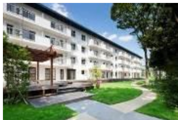
築50年のUR団地再生「りえんと多摩平」 www.share-place.com/tamadaira.shtml