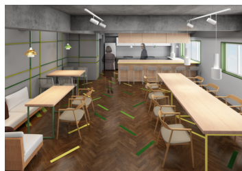
シェアラウンジ (イメージパース)