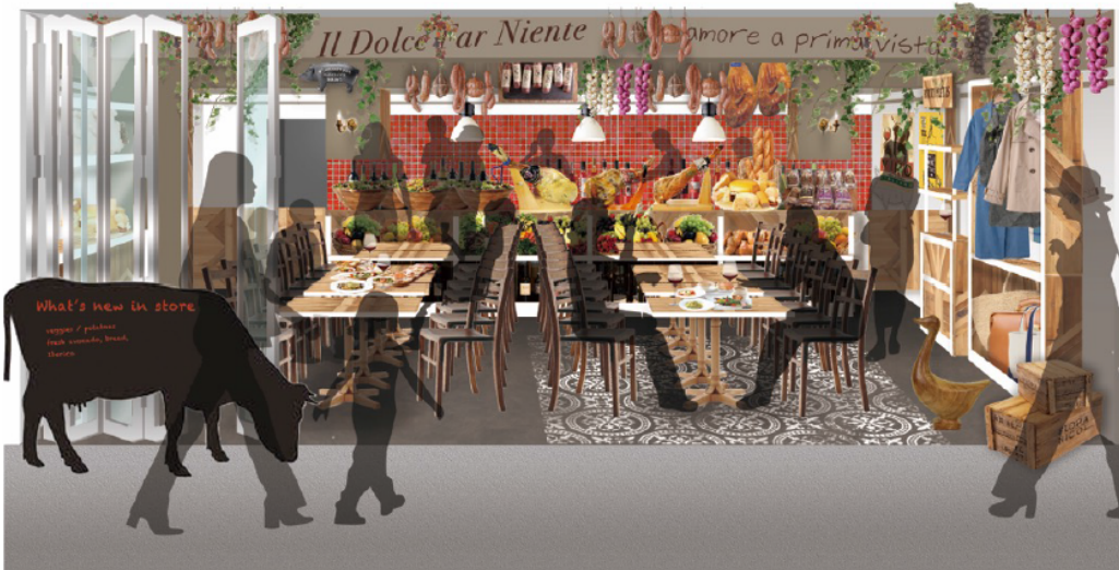
飲食店舗（イメージパース）