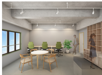
スモールオフィス専有区画 (イメージパース)