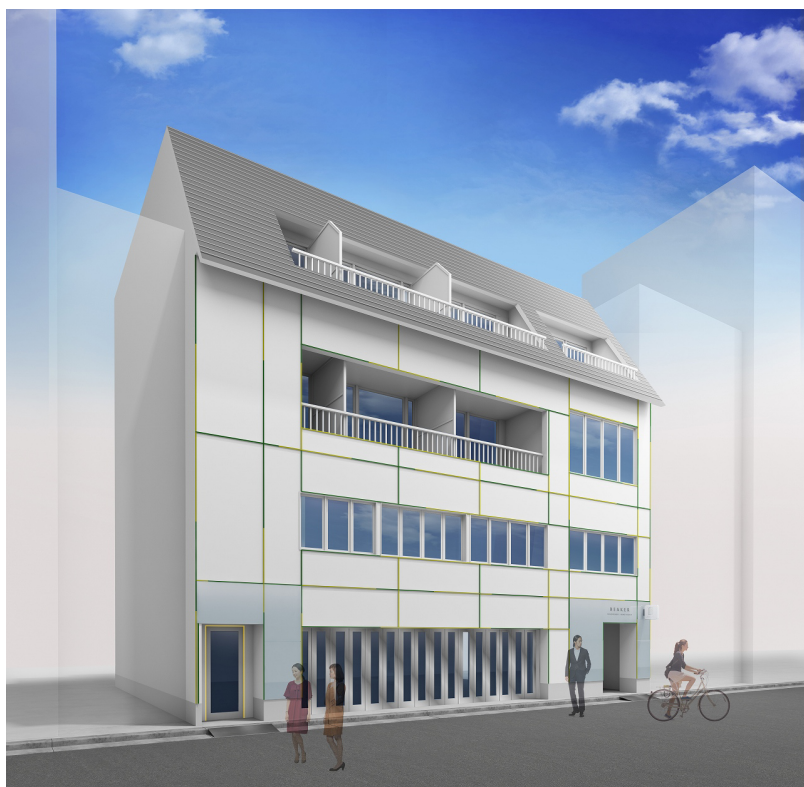
外観 (イメージパース)