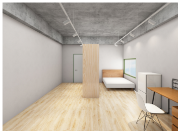
シェア型賃貸住宅専有部 (イメージパース)