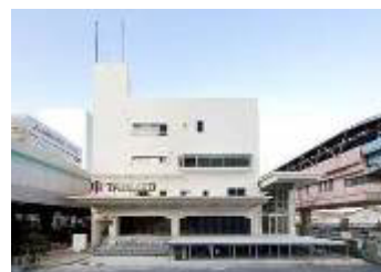
オフィス商業複合施設「TABLOID」 www.tabloid-tcd.com/