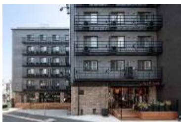
原宿神宮前「THE SHARE」 www.the-share.jp/

名称：株式会社リビタ 設立：2005 年（2012 年より京王グループ） 代表取締役社長：都村 智史 住所：東京都目黒区三田 1-12-23MT ビル URL： www.rebita.co.jp