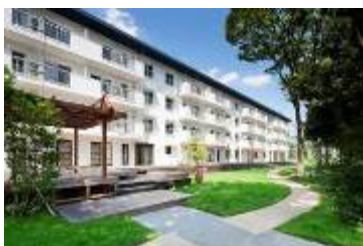
築 50 年の UR 団地再生「りえんと多摩平」 www.share-place.com/tamadaira.shtml