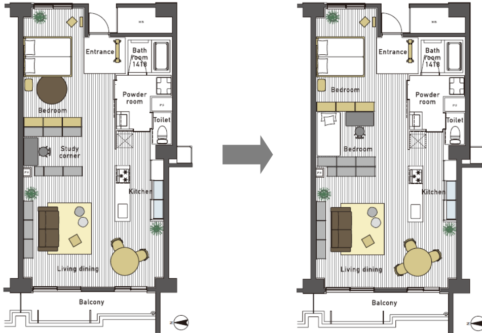
入居1年目：夫婦2人暮らし

縦に長くのびる空間を家具でゆるやかに仕切り、空間はつながっているがまるで1LDKのような間取りを実現。収納家具で間仕切り、ちょっとした書斎空間などをつくることも可能です。ライティングレールに植物を吊るして癒しの空間を演出したり、壁を自分好みにペイントしたりするなど、自分たちで手を加えられる余白をつくりました。また、家の中の別々の場所で思い思いに過ごしていても、なんとなくお互いの存在を感じられます。同じ家の中にいても、自分の部屋にこもりがちで、食事中も携帯電話をさわるばかりで会話も少なくなっているといわれる現代だからこそ、家族の温かみを感じられる住まいを目指しました。