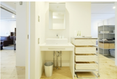
4. 家のどこからでも行きやすい動線に設置した水回り