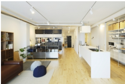
1. 専有面積約74㎡を間仕切らない一室空間に