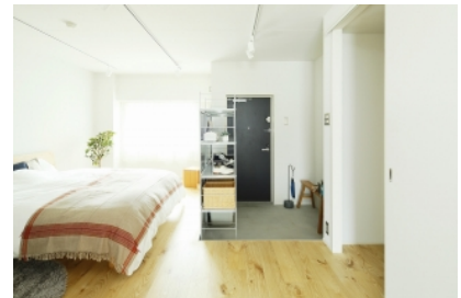
3. 玄関は広い土間を設置