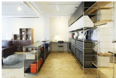
5. インテリアで空間を仕切る