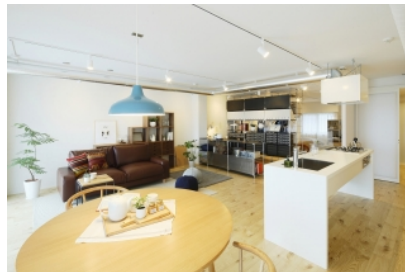
2. 家の中をすみずみまで見渡せるキッチン