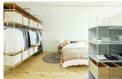
6. クローゼットも兼ねた寝室