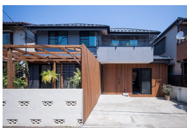
戸建てリノベーション「HOWS Renovation」