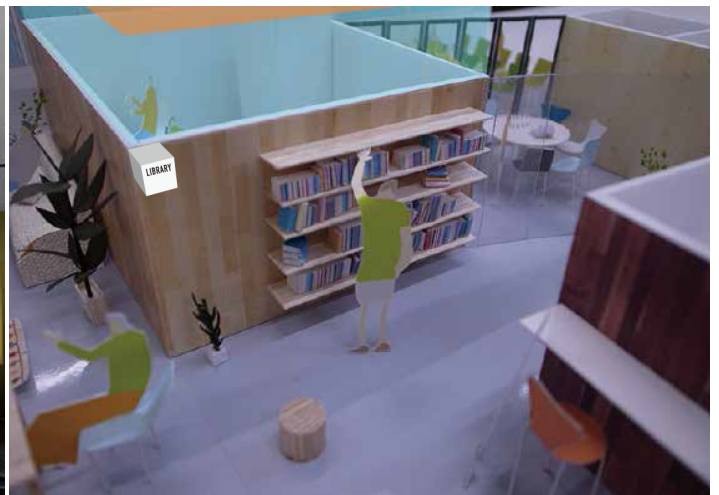
シェアオフィスイメージ