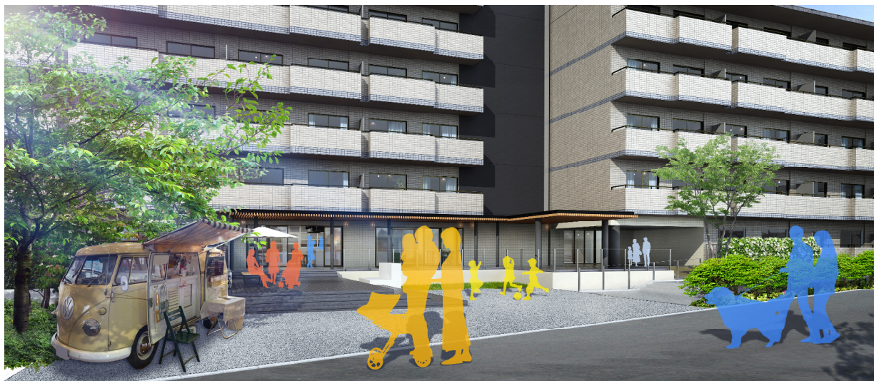
<エントランス完成予想CG>

「試住」とは、『リノア新松戸』の賃借人が将来的に同物件を購入する場合、賃貸借契約中に支払った賃料を一部購入資金に充当可能な仕組みです。マンション購入を検討しているものの、実際に住んで物件や周辺環境を体感した上でじっくり考えたい人、住みながらリノベーションプランを考えたい人、時間をかけて購入資金を用意したい人が、将来の購入を見据えた新しい住まい選びをすることが可能になります。