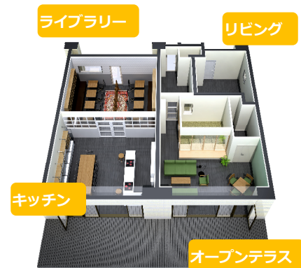
<コモンルーム完成予想 CG>

鏡張りの壁があり、雨の日の子供たちの遊び場やヨガなどのサークル活動に利用することができます。