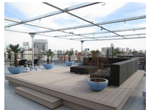
△wifi 完備のスカイリビング