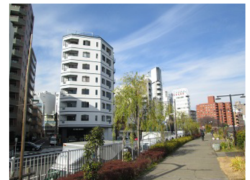
△地域のランドマークとなる外観

イエ、モノ、マチを ※東日本橋一棟ごとリノベーション! 敷地 つなぐ展 2014.6.28 (Sat) Limited OPEN! AM11:00 ~ PM6:00