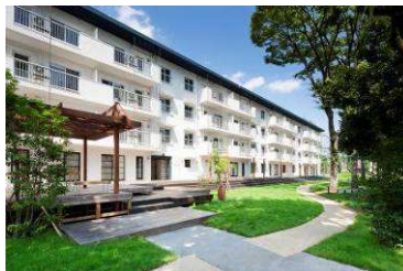
築50年のUR団地再生「りえんと多摩平」