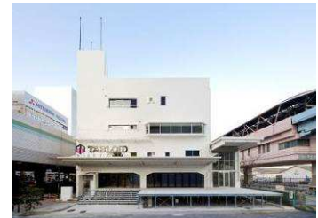
オフィス商業複合施設「TABLOID」