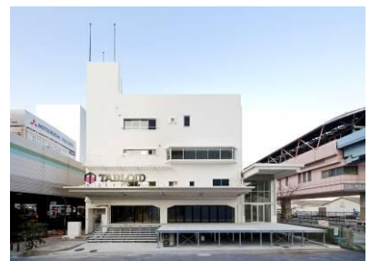
オフィス商業複合施設「TABLOID」