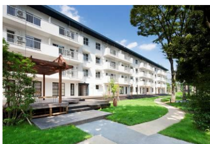
築50年のUR団地再生「りえんと多摩平」