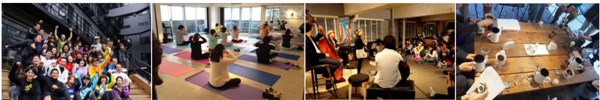
部活イメージ（リビタ実績より）

Facebook： www.facebook.com/bukatsudo.yokohama