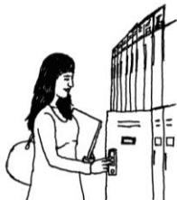
Illustration: NAUJEL GRAPH

BUKATSUDOには、活動に関わる道具などをしまっておくための、ロッカーや倉庫があります。